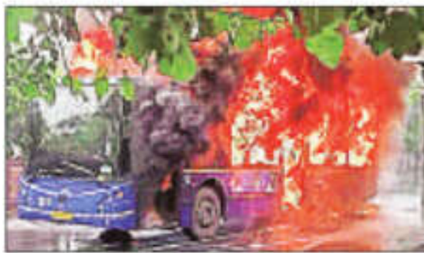
कारणों का पता लगाने के लिए बस निर्माता कंपनियों की ओर से जांच की जाएगी। बताया जा

जगतपुरी थाना क्षेत्र में गुरुवार सुबह सवारियों से भरी एक एक बस में अचानक आग लग गई। घटना के वक्त बस में करीब 40-50 यात्री सवार थे। अधिकारियों ने बताया कि हादसे में किसी के हताहत होने की खबर नहीं है। वहीं, दिल्ली परिवहन विभाग के अधिकारियों ने बताया कि मामले में जांच के आदेश दे दिए गए हैं और आग लगने के